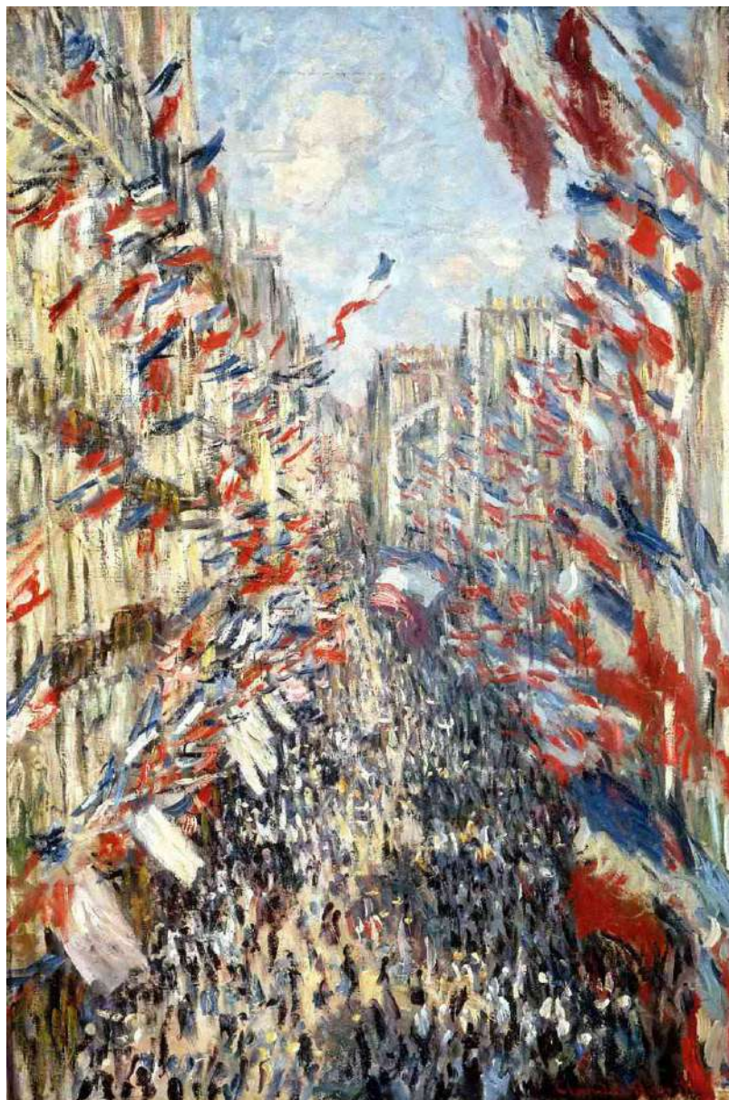
← La Rue Montorgueil , Claude Monet, 1878

LES REPRÉSENTATIONS DE LA FÊTE NATIONALE