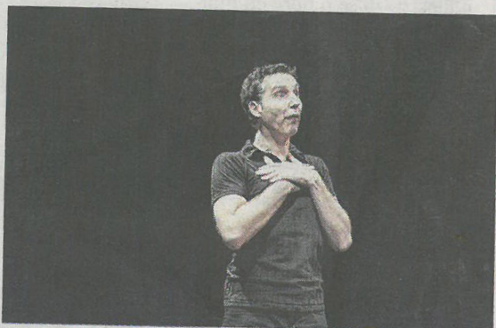
Le comédien Willy Clayessens est seul sur scène dans cette nouvelle création de l'Aventure.

Au théâtre de l'Aventure, 27 rue des Écoles à Hem. À partir de 10 ans. De 3 € à 8 €. Réservations 03 20 75 27 01.