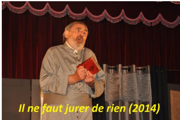
Il ne faut jurer de rien (2014)