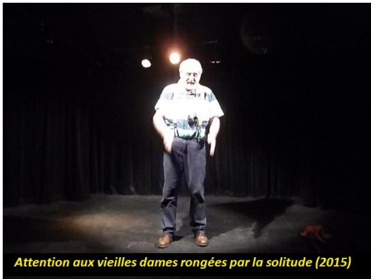
Attention aux vieilles dames rongées par la solitude (2015)