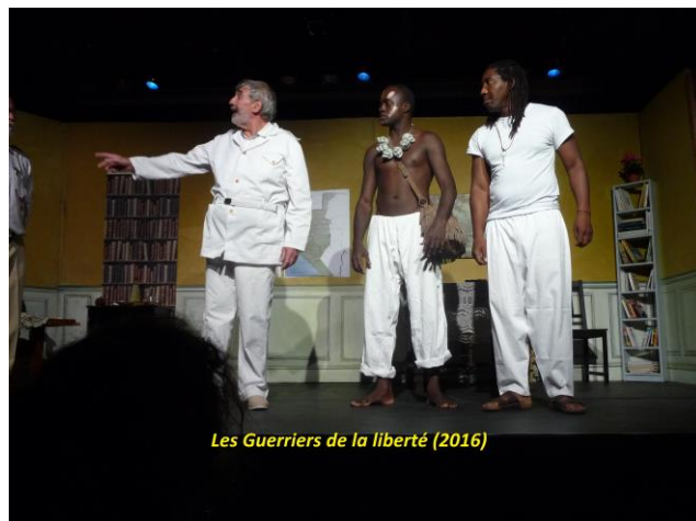
Les Guerriers de la liberté (2016)