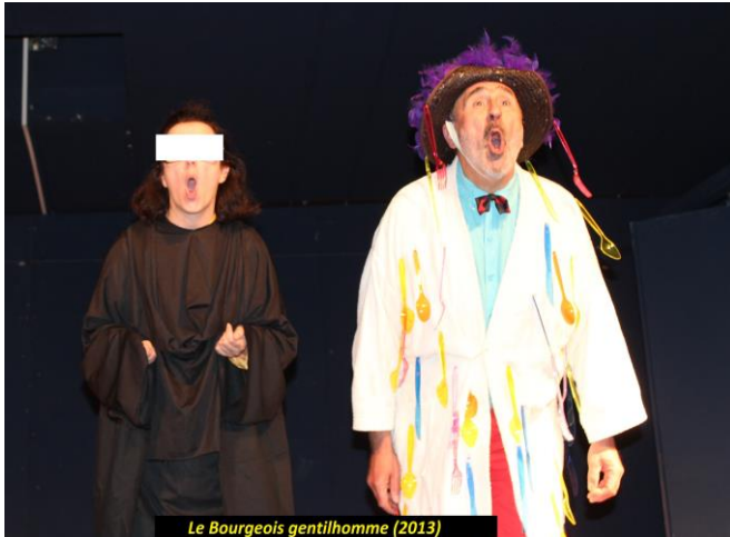
Le Bourgeois gentilhomme (2013)